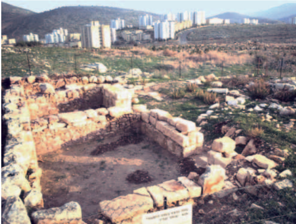
כנסיית המנזר בחורבת בתה

סביבתו הקרובה. ברצפת הפסיפס שלה נתגלו שמונה עשרה כתובות משלב הבנייה הקדום, ככל הנראה בתחילת המאה השישית, ושתיים מהשיפוץ שנעשה בה בהמשך אותה מאה. בכתובות נרשמו שמות של אנשים שלא השתייכו לממסד הכנסייתי ושל אנשי כנסייה. בצד הבישוף סטפנוס נזכרו כוהנים (פרסביטרים [presbyteroi]), שמשים לדרגותיהם (ארכידיאקונים [archidiakonoii], דיאקונים [diakonoii], תת-דיאקונים [hypodiakonoii]), קוראים (אנאגנוסטס [anagnostes]) וגם מנהל משק הכנסייה (אויקונומוס [oikonomos]). הכנסייה ניטשה במאה השביעית. איננו יודעים באיזו עיר כיהן הבישוף סטפנוס – בציפורי שבפלסטינה השנייה או בעכו שבפניקיה – אבל אזכורו בכתובת ומספרם הגדול של בעלי התפקידים במדרג הכנסייתי שנרשמו בה מצביעים על חשיבותו של הכפר באזור. 13 גם בכנסיות בכפרים גליליים אחרים נתגלו כתובות שעשויות להעיד על חשיבותם ועל מרכזיותם. למשל בשרידי הכנסייה שנחשפו בקיבוץ עברון נזכרו כעשרים בעלי תפקידים במדרג הכנסייתי ובהם בישוף, ככל הנראה הבישוף של עכו; בכתובת בכנסייה בחורבת כרכרה נזכרו בישוף כפרי (חוראפיסקופוס [chorepiscopos]), מפקח כנסייתי (פריודויטס [periodeutes]) וארכיבישוף, כנראה