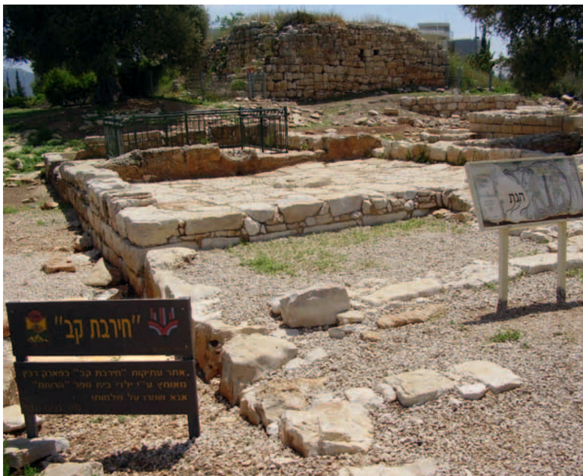
הגת במנזר, חורבת קב

האתר נמצא על גבעה קטנה, כ־400 מ' בקו אוויר מדרום־מערב למנזר שבחורבת זגג, בתחום פארק משחקים בשכונת רמת־רביץ. האתר נפגע קשות בשנות השישים של המאה העשרים מעבודות חציבה אינטנסיוויות, ולאחר מכן נעשו בו שתי חפירות הצלה. בשלב הראשון, בקצה הצפוני של האתר, נחשפו שרידי מבנה שנהרס בשרפה. 18 בין אבני הריצוף של החצר התגלה מטמון של חמישים מטבעות זהב בתוך נר שמן, וזמנן אינו מאוחר משנת 663 לסה"נ, מה שמלמד שהאתר היה מיושב לפחות עד