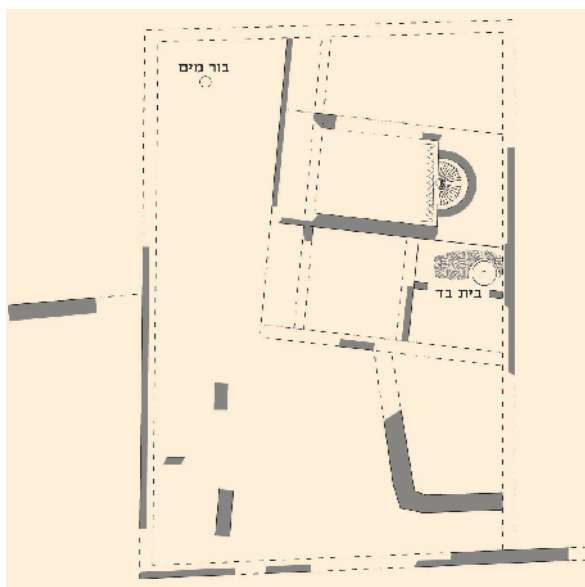
תכנית חורבת זגג