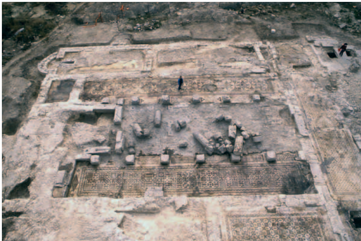
המנזר בחורבת כנס